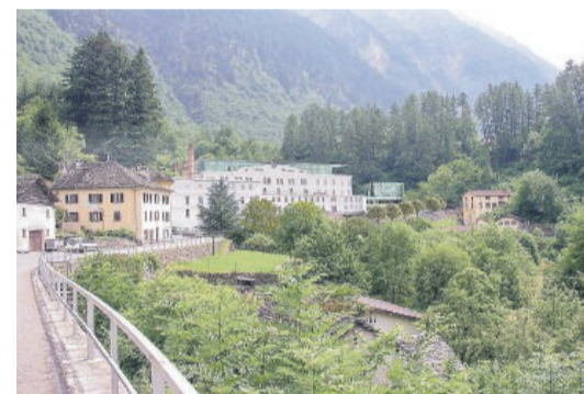
In arrivo una serata d'informazione per gli abitanti

realizzazione del Centro turistico alberghiero ad Acquarossa. Nel progetto inclusa anche l'idea di realizzare un'ottantina di parcheggi, la volontà di attuare una soluzione energetica ecosostenibile, secondo gli standard e le normative più recenti. I promotori, i quali hanno in programma di organizzare una serata pubblica per spiegare il progetto alla popolazione, spiegano infine che le scelte architettoniche saranno ponderate al fine di mantenere il più possibile il carattere 'industriale' del complesso.